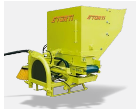
Sweeper disponibile anche in versione portata Sweeper is available also on tractor third point attached version

Sweeper ist auch in Anhängerausführung verfügbar Sweeper est disponible aussi en version portée sur le troisième point.