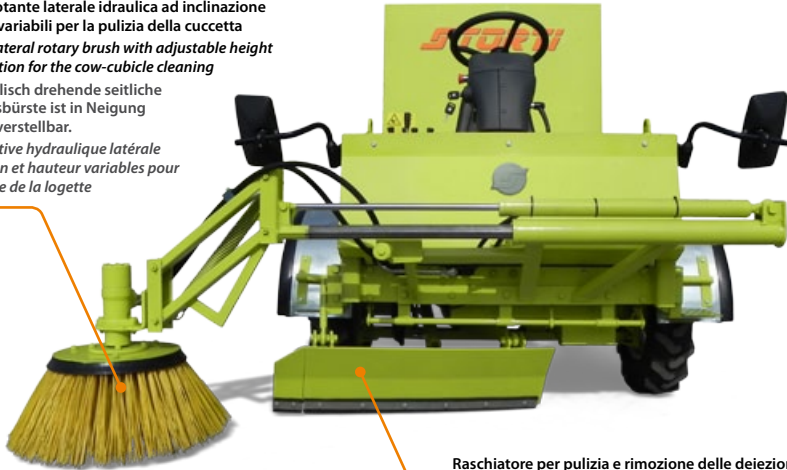
Raschiatore per pulizia e rimozione delle deiezioni Scraper for dejections removal and cleaning Kratzer zur Kuhmist Reinigung und Entfernung Racleur pour le nettoyage et l'enlèvement de fumier

Brosse rotative hydraulique latérale à inclinaison et hauteur variables pour le nettoyage de la logette